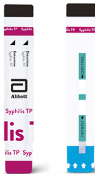
DETERMINE™ SYPHILIS TP