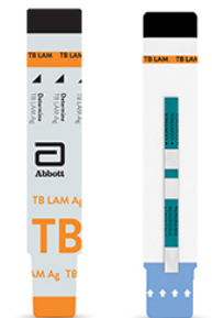
DETERMINE™ TB LAM Ag